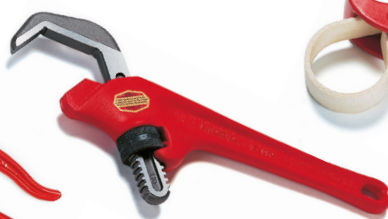
Šestihranné hasáky na šroubení